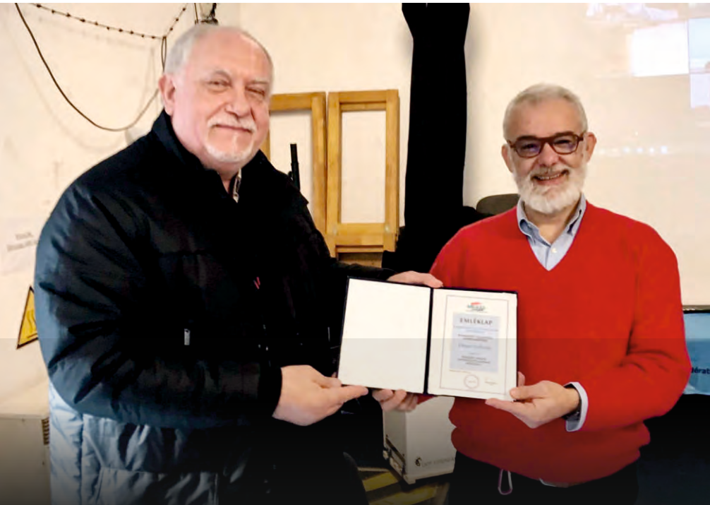
Filippo Giuffrida Répaci olasz antifasiszta újságíró 2021. november közepén, Berlinben vette át a még 2020-ban odaítélt Radnóti-díját.

1945-ben Európa népei együttélésének új szakasza kezdődött el. A háborúban győztes szövetségesek lefektették a háború utáni európai rend alapjait. Tudnunk kell, hogy 1945-ben szellemi elődeink katonai győzelmet arattak a náci-fasizmus fölött, de mára világos számunkra, a náci-fasizmus embertelen eszméjét nem sikerült elpusztítani. Egyre szükségesebb a szélsőjobb oldali populizmus és demagógia elleni határozott föllépés! Össze kell fogunk az intolerancia, a neonácizmus megnyilvánulásai ellen egy igazságosabb, szolidárisabb világért, ahol embertársaink a társadalomból nem rekesztődnek ki azért, mert más a bőrszínük, a hitük, a kultúrájuk, a véleményük, vagy netán más a nemi identitásuk.