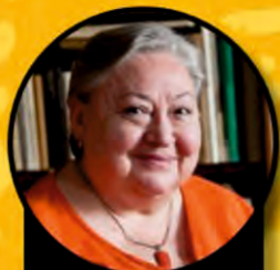
MOLNÁR PIROSKA színművész