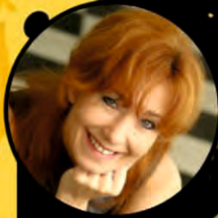
SZALAY KRISZTA színművész